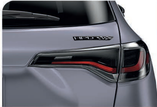
Emblema trasero HPD