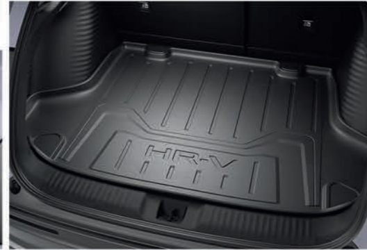
Bandeja de carga