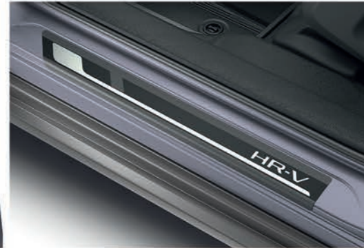
Película protectora para piso de puerta