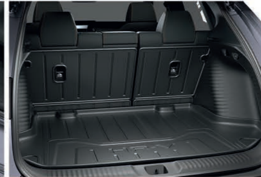
Protectores de asientos traseros