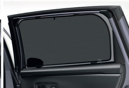
Sombra de ventana trasera