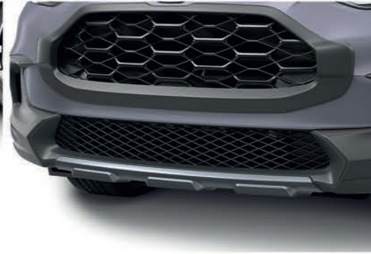
Adorno de defensa delantera color negra