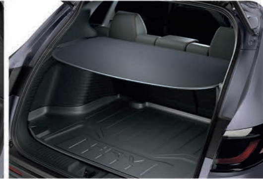
Cubierta protectora de carga