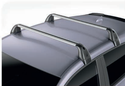
Rack de techo