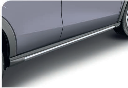
Adorno inferior para puertas laterales