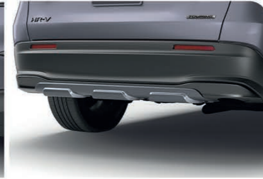
Adorno inferior de defensa trasera