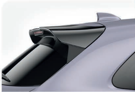
Alerón trasero color negro