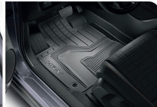
Tapetes toda temporada