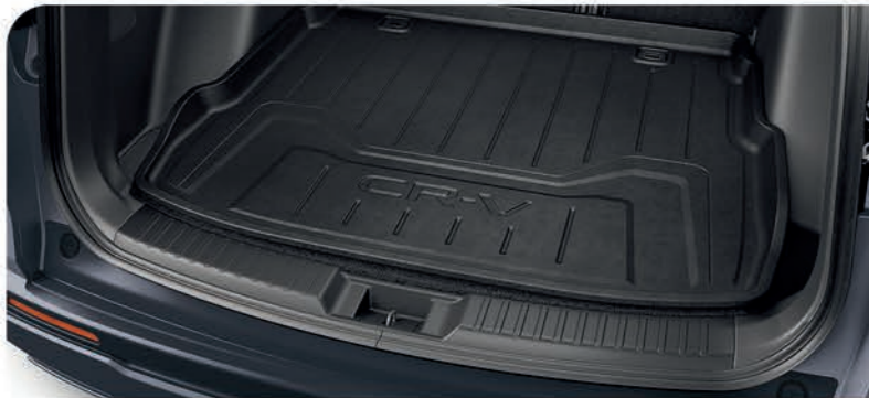
Bandeja de carga