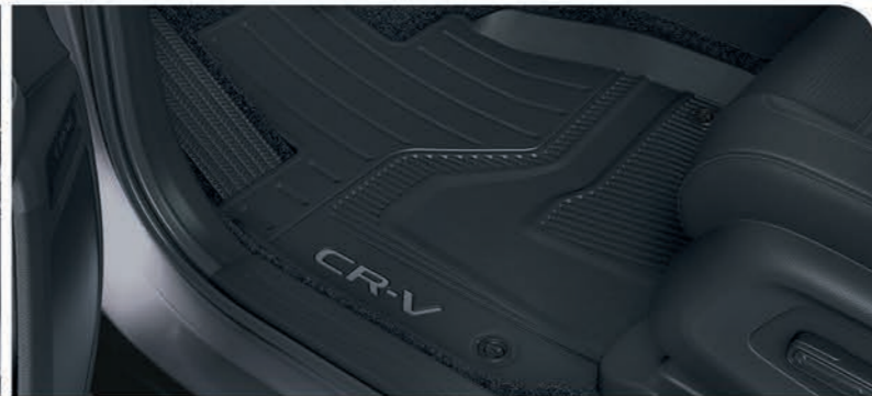
Tapetes toda temporada