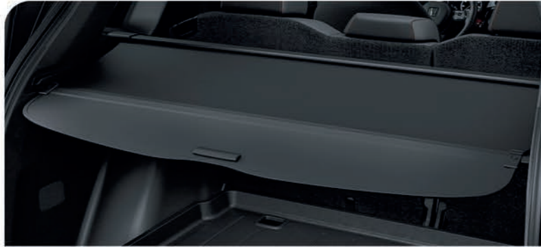
Cubierta de carga retráctil