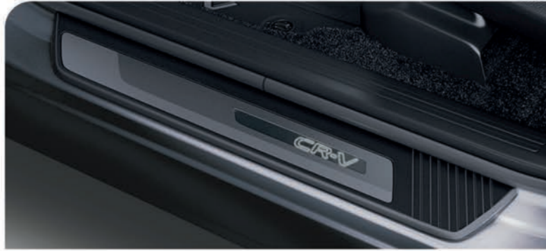
Adorno de piso de puerta iluminado