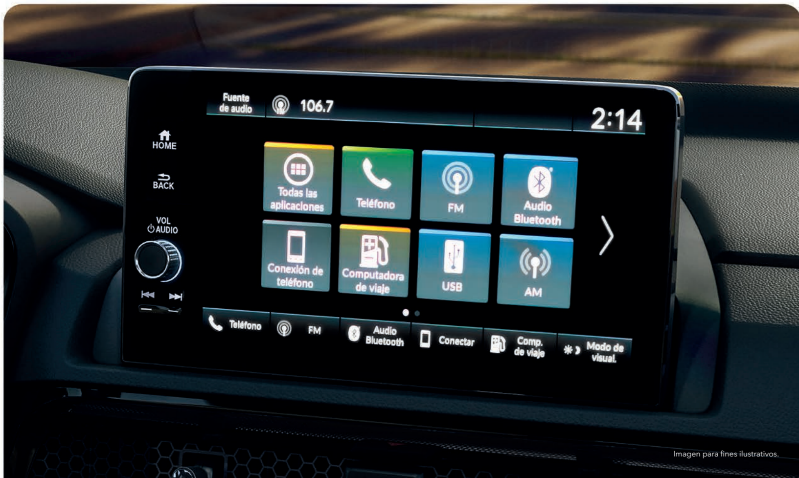
Imagen para fines ilustrativos.